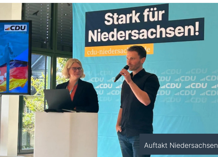
Auftakt Niedersachsenplan der CDU Niedersachsen