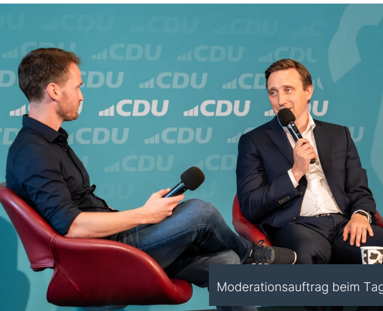
Moderationsauftrag beim Tag der Offenen Tür im Landtag