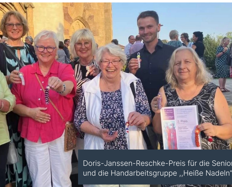
Doris-Janssen-Reschke-Preis für die Seniorinnen und Mitarbeitenden im Paul-Gerhardt-Heim und die Handarbeitsgruppe „Heiße Nadeln“