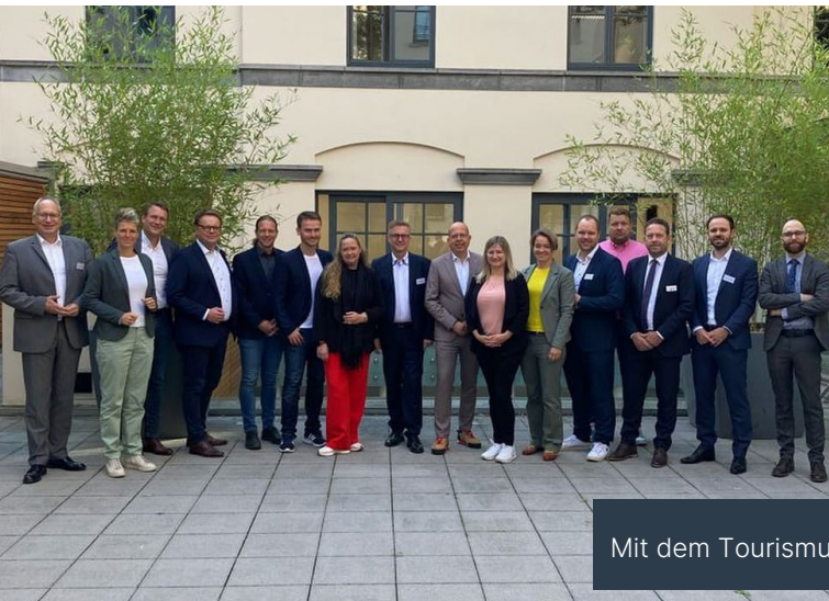
Mit dem Tourismusausschuss in Brüssel