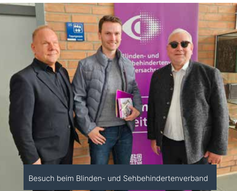
Besuch beim Blinden- und Sehbehindertenverband