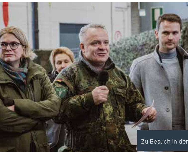
Zu Besuch in der Kaserne in Rotenburg