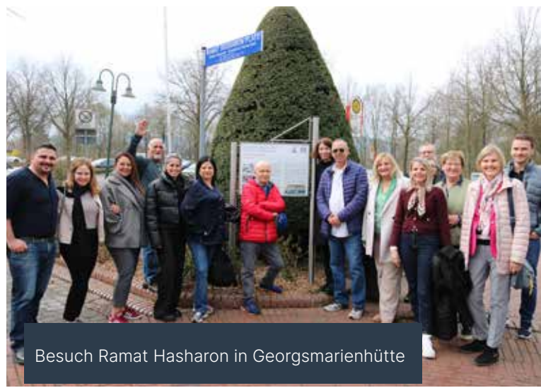
Besuch Ramat Hasharon in Georgsmarienhütte