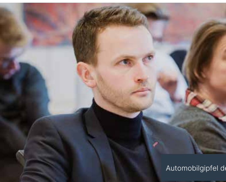
Automobilgipfel der CDU-Landtagsfraktion