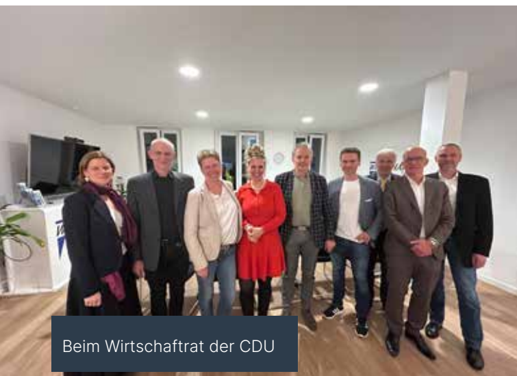
Beim Wirtschaftsrat der CDU