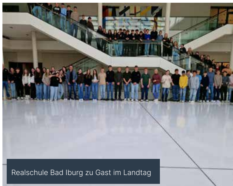
Realschule Bad Iburg zu Gast im Landtag