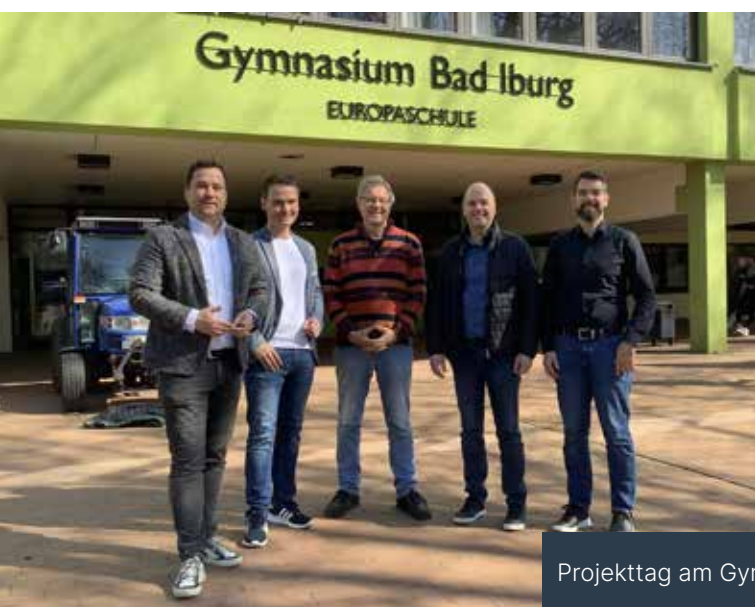
Projekttag am Gymnasium Bad Iburg