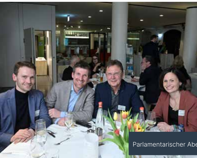
Parlamentarischer Abend von GewiNet und Barmer